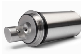
Sonda de turbidez