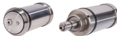
Sensor tipo Varivent® Sensor 25 mm