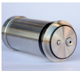
Sensor de O 2 (opcional)